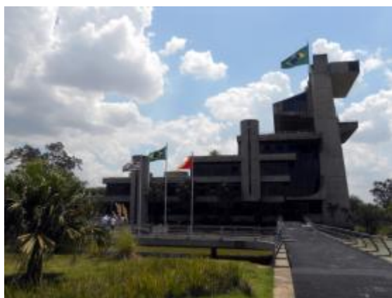
Prefeitura Municipal de Sorocaba