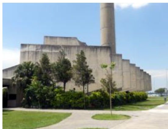
Teatro Municipal Teotônio Vilela

Copyright 2012 – Todos os Direitos Reservados